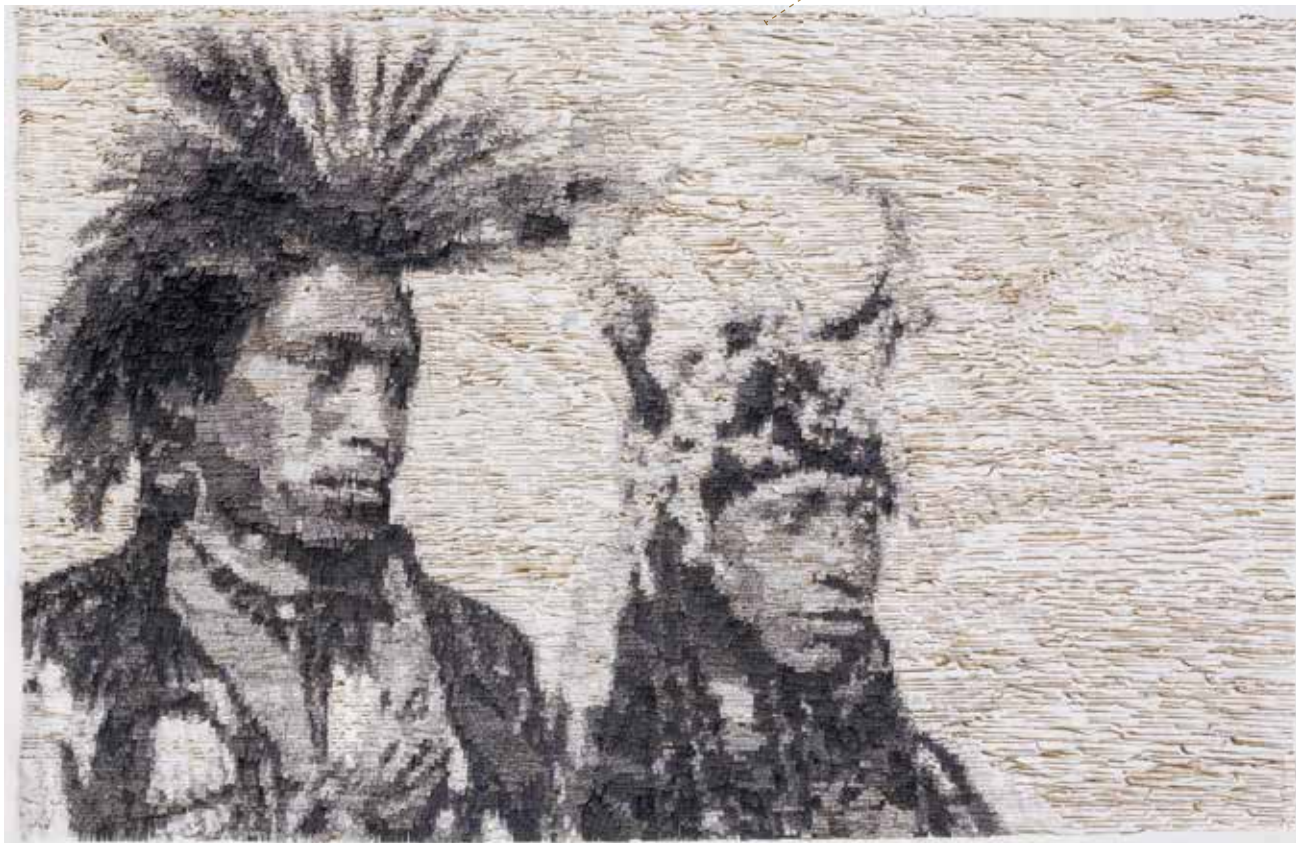
Natives / papier japonais, encre / 2014