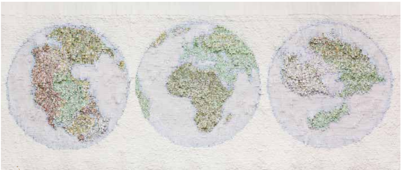
--- Pangée / cartes routières, calque, papier épais / 2012 ©Kleinefenn