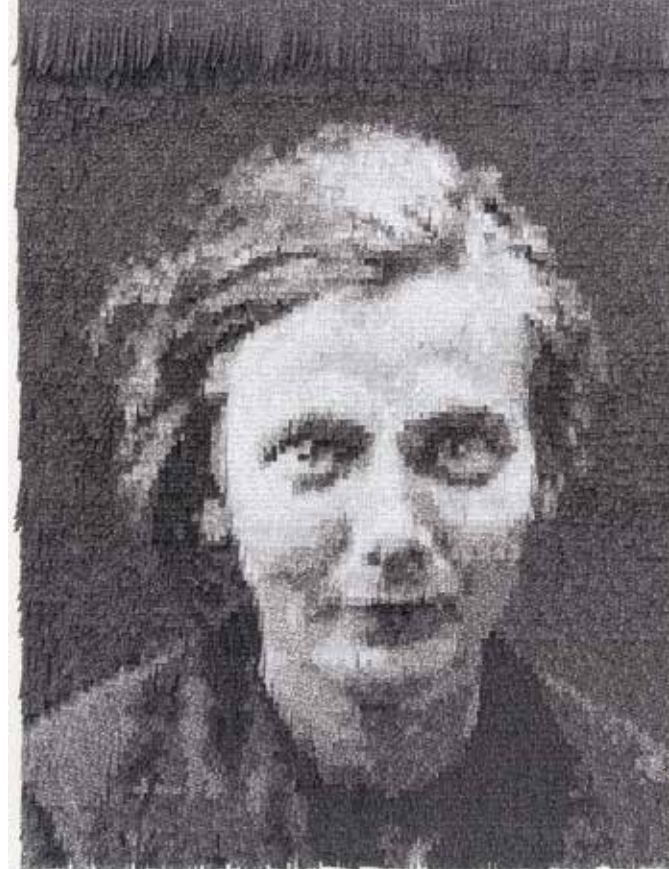
Esther (face) / papier japonais, encre / 2014