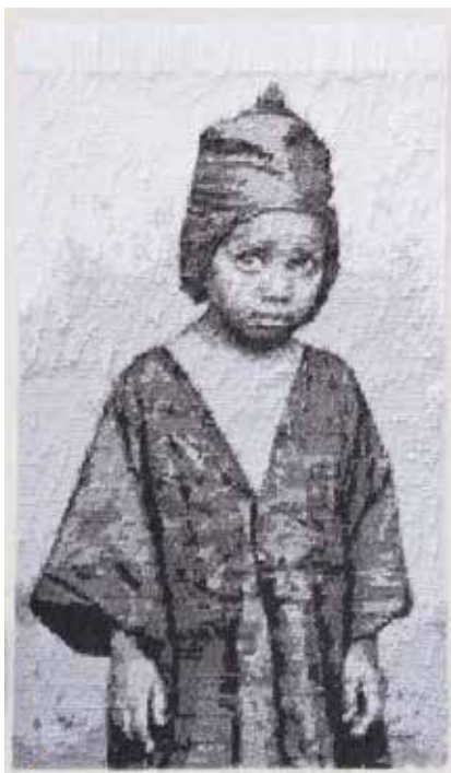
Le passage (1) / papier japonais, encre / 2013