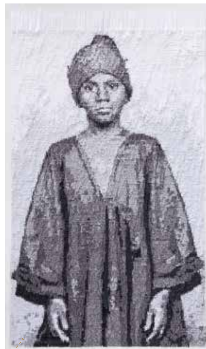
Le passage (2) / papier japonais, encre / 2013 ©Kleinefenn