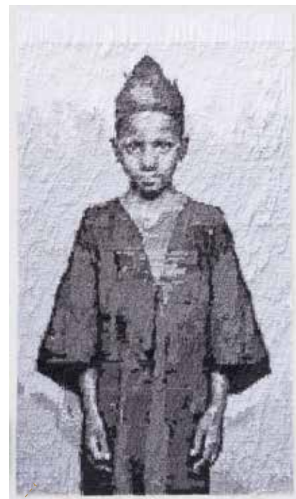
Le passage (3) / papier japonais, encre / 2013