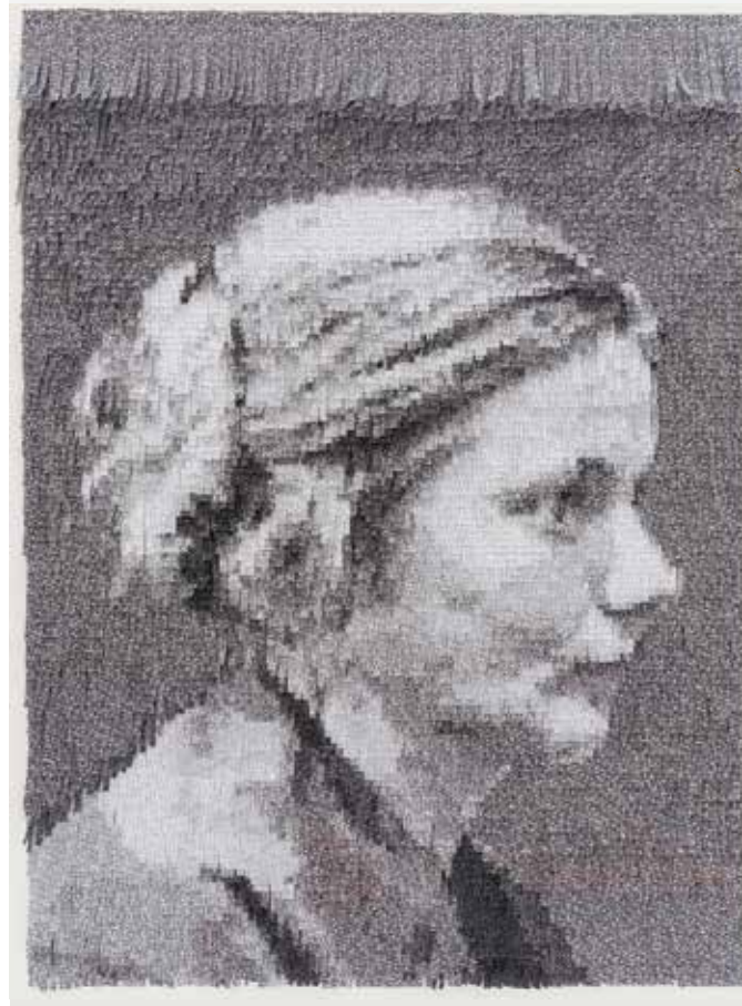
Esther (profil) / papier japonais, encre / 2014