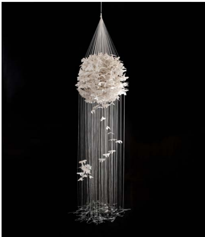
Tsuyu Bridewell, Sentôchô , 2016