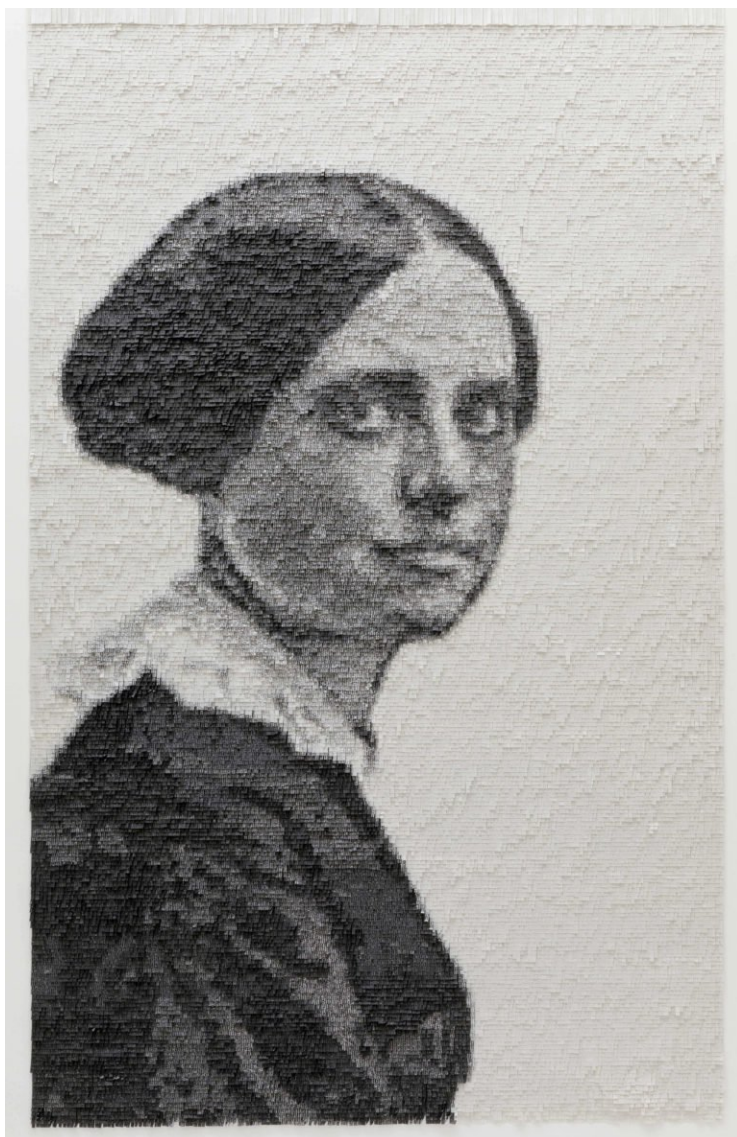
Nathalie Boutté, Les deux sœurs, 2016, Papier japonais, encre, 161 x 97 cm, Courtesy Yossi Milo Gallery, New York, © Nathalie Boutté.

https://www.beauxarts.com/grand-format/les-sculpteurs-de-papier-prennent-leur-envol/