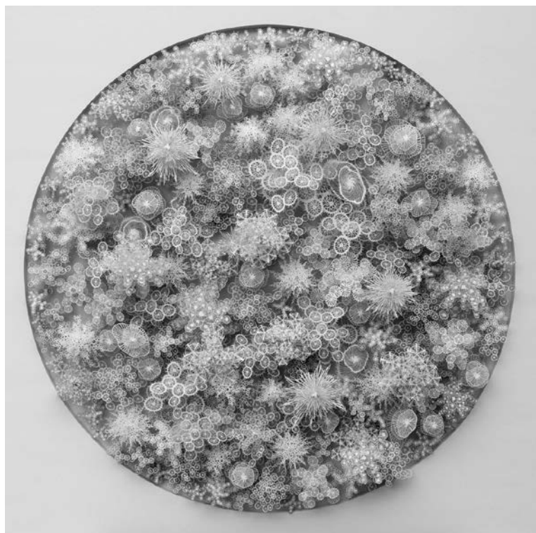
Rogan Brown, Magic Circle, Variation 6 , 2018