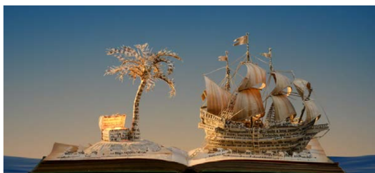
Su Blackwell, Treasure Island , 2013

En découpant les pages de livres anciens laissés ouverts, l'artiste et illustratrice anglaise Su Blackwell en fait émerger châteaux, arbres et décors féériques agrémentés de sources lumineuses, une façon de matérialiser l'inspiration procurée par la lecture. Quant à l'Américain Brian Dettmer, il aborde les livres comme des blocs à sculpter : à mi-chemin entre Salvador Dalí et Jérôme Bosch, ses compositions psychédéliques s'inspirent de l'univers des encyclopédies, des planches d'anatomie et autres ouvrages anciens.